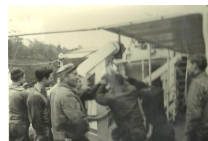
Bådøvelse med besætningen og bådsen i spisen

Hvorefter vi fortsatte til Arden for at bunke, inden vi satte turen mod Tasmanien.