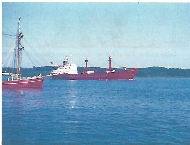
FENJA DAN & LILLA DAN ud for Søfartsskolen