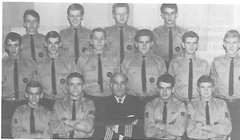
Chefen (chefelev & NK på hver side) & seniorholdet efteråret 1965

Om episoden med "LILLA DAN" har haft indflydelse, husker jeg IKKE, hvorom alting er, fik jeg på mit afgangsbetragning et ½ år senere "kun" 4 i opførsel.